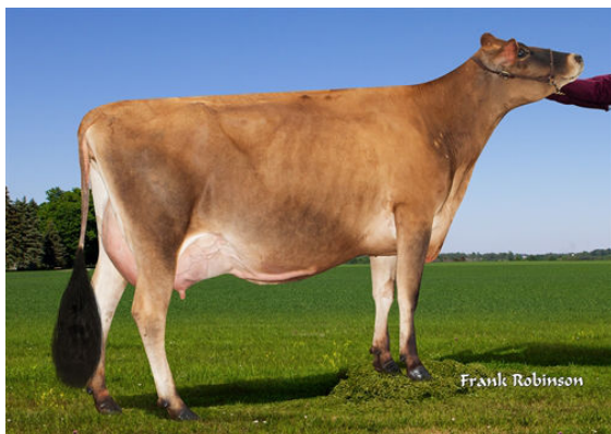
JX PROGENESIS CINDERELLA {6}

JX PROGENESIS GRACE TOO {5} DES-73%-2YR-USA