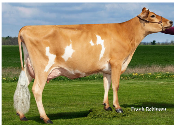
PROGENESIS CRAZE CORD {6}